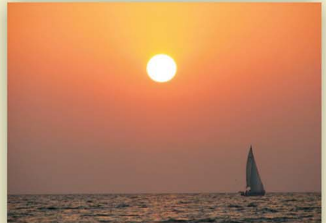
Фотоархив семьи Волковых: "Прогулка на яхте на закате"

Я пользуюсь только современными средствами финансовых расчетов в надежном банке.