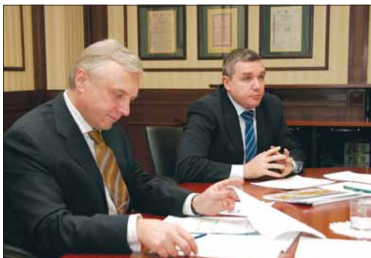
Председатель правления Евразийского банка развития Игорь Финогенов и президент Ханты-Мансийского банка Дмитрий Мизгулин

Напомним, в конце октября ЕАБР, учрежденный Российской Федерацией и Республикой Казахстан, вошел в уставный капитал Ханты-Мансийского банка, выступая в качестве представителя группы новых акционеров при взаимодействии с правительством Югры.