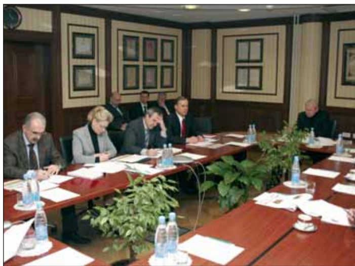
Заседание совета директоров

«Это, несомненно, придаст импульс развитию приграничной торговли и инвестиций между Российской Федерацией и Республикой Казахстан. Сотрудничество ЕАБР с Югрой основано на общности задач. Со стороны ЕАБР это обусловлено возможностью участвовать в соответствии со своей миссией и стратегией развития в проекте со значительным интеграционным эффектом и эффектом развития, со стороны автономного округа – основного акционера Ханты-Мансийского банка – привлечь стратегического партнера для развития и диверсификации экономики ХМАО и соседних регионов», – заявил руководитель ЕАБР.