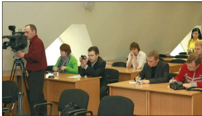
Под пристальным вниманием прессы