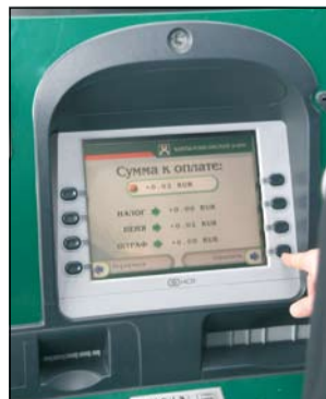
Услуга по приему налоговых платежей уже работает