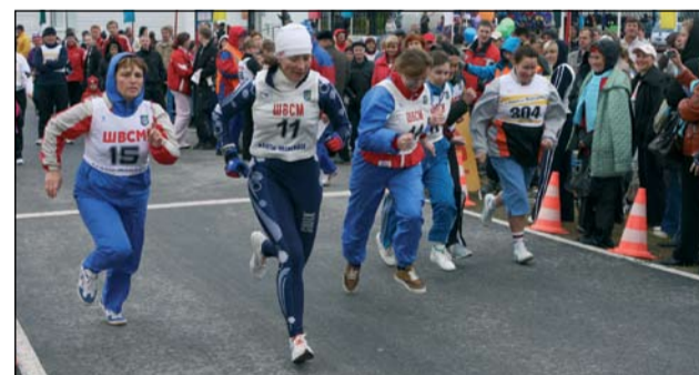
Старт женского забега

В окружном центре прошел легкоатлетический кросс «Золотая осень», участие в котором приняли более 200 спортсменов, представлявших 19 предприятий и организаций города.