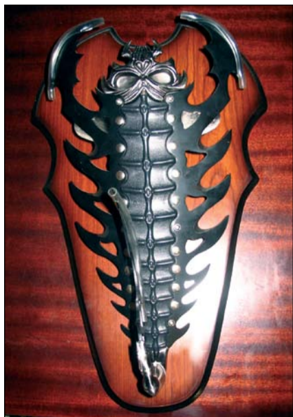
Американский экспонат коллекции