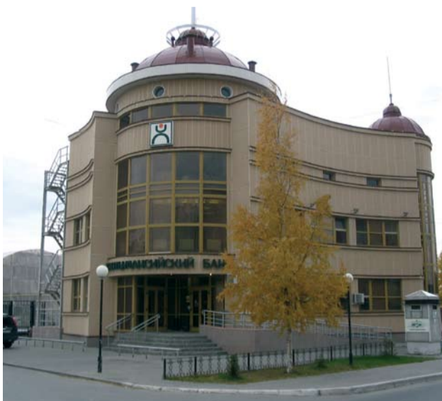
Здание головного офиса филиала Ханты-Мансийского банка в г. Белоярском

И выбирает он сегодня Ханты-Мансийский банк. Это решение основано на доверии и стабильности финансового учреждения – самого молодого банка в Белоярском районе.