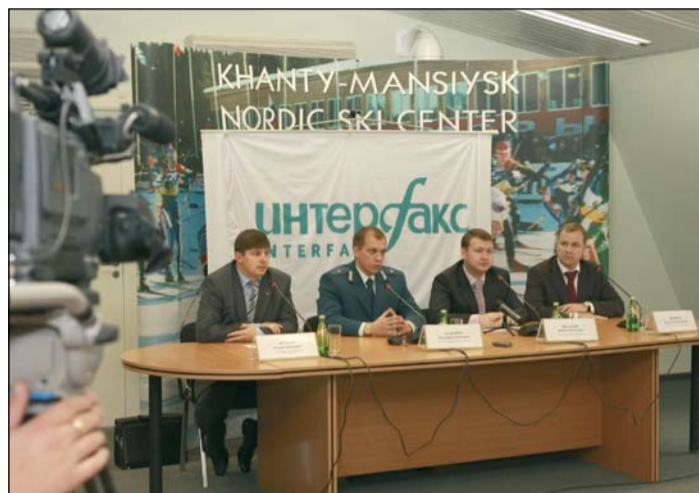
Совместный брифинг налоговой службы и Ханты-Мансийского банка

В Югре презентовали первую в России услугу по оплате налоговых платежей через банкоматы