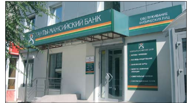
Здание нового дополнительного офиса в Тюмени

Ханты-Мансийский банк открыл новый, восьмой по счету, офис в Тюмени, находящийся по адресу: ул. Малыгина, д. 71/6.