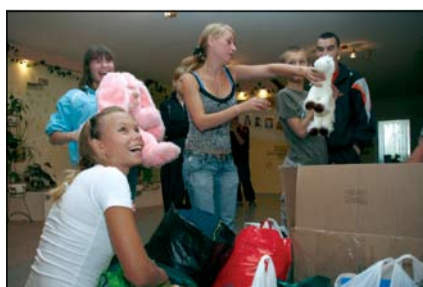
Воспитанники детского дома «Радуга»

В рамках празднования 16-летия со дня образования Ханты-Мансийский банк провел акцию «Благотворительный марафон» среди сотрудников кредитной организации. Цель мероприятия – сбор игрушек, вещей, книг для передачи в детские сиротские учреждения города Ханты-Мансийска.