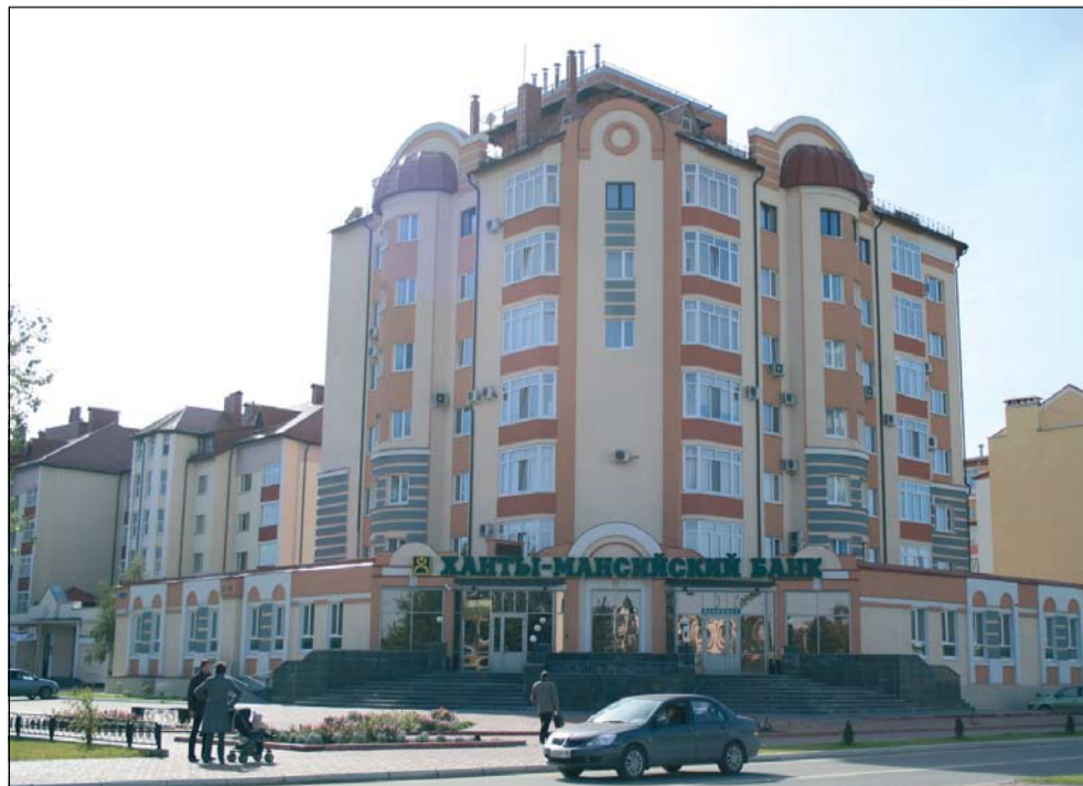
Здание филиала Ханты-Мансийского банка в Югорске

Кроме этого, наш филиал оказывает постоянную финансовую поддержку в реализации городских социальных проектов, выступает спонсором в проведении всевозможных мероприятий, оказывает персонализированную помощь населению. Филиал становился лауреатом городского конкурса в номинации «Меценат года» и отмечен благодарственным письмом главы Югорска. Таким образом, можно уверенно сказать, что Ханты-Мансийский банк занимает активную социальную позицию, заботится о качестве жизни населения города.