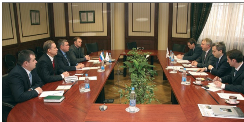
Переговоры о долгосрочном сотрудничестве между Ханты-Мансийским банком и Евразийским банком развития

«Ханты-Мансийский банк остается государственным – контрольный пакет акций принадлежит правительству ХМАО – Югры. Наши планы напрямую связаны с интенсивным развитием на территории округа, а дополни-