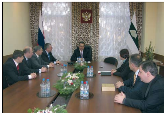
Руководители Ханты-Мансийского банка на встрече с Губернатором Курганской области Олегом Богомоловым

Губернатор Олег Богомолов особо отметил тот факт, что крупный региональный банк открывает свою сеть в Зауралье в сложный период. «Значит, экономика в скором времени начнет оживать», – заявил глава Курганской области. По его словам, для региона в первую очередь важны инвестиции, поскольку от того, как смогут кредитоваться предприятия машиностроительного и агропромышленного комплексов, малый и средний бизнес Зауралья, зависит и результат работы области в целом.