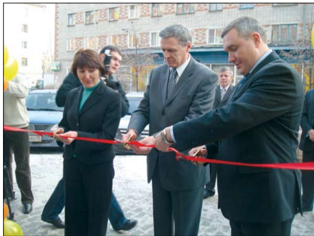
Торжественное открытие филиала Ханты-Мансийского банка в г. Кургане

Ханты-Мансийский банк открыл филиал в г. Кургане, который стал 18-м по счету и первым подразделением банка в Зауралье.