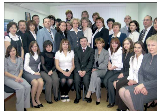
Коллектив филиала Ханты-Мансийского банка в г. Ноябрьске

Безусловно, 2009 год будет сложным для всех. Но мы готовы к предстоящим трудностям, и, оценивая реалии, могу сказать, что у нас хватит и профессионализма, и ресурсов, чтобы продолжить развитие.