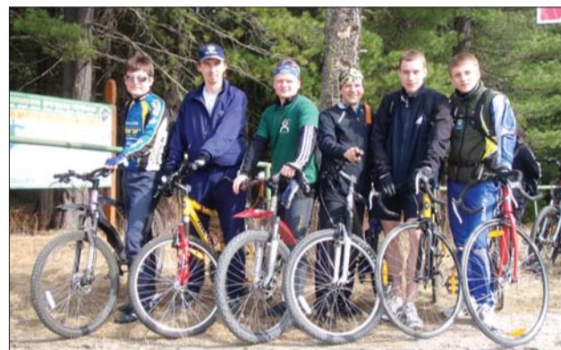
Сотрудники Ханты-Мансийского банка – участники велопробега

В поселке для спортсменов был организован привал с чаем, бутербродами и фронтовыми песнями. А не рассчитавших силы велосипедистов ждал автобус, совершивший обратный путь в Ханты-Мансийск. Нужно отметить, что вся группа банка вернулась домой своим ходом.