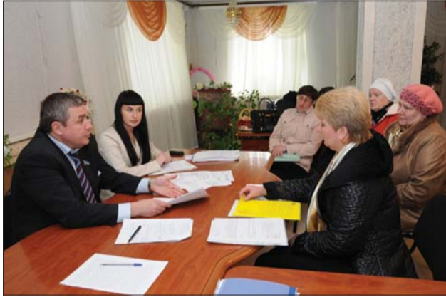
Встреча с избирателями