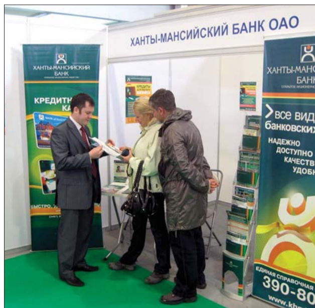
Выставочный стенд Ханты-Мансийского банка: консультация представителей малого бизнеса

85 экспонентов, представляющих производственную сферу, агропромышленный комплекс и пищевую