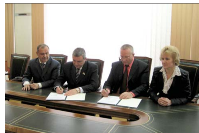
Подписание соглашения с администрацией Нефтеюганского района