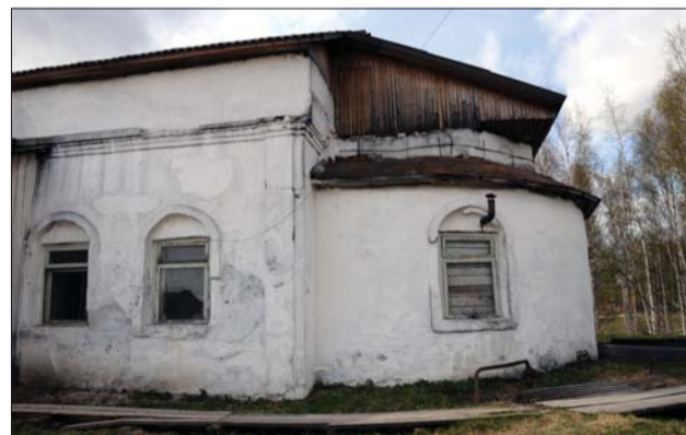
Так выглядит сегодня древний храм во имя Вознесения Господня в п. Горноправдинске

р/с 4070381020000000105 в ОАО ХАНТЫ-МАНСИЙСКИЙ БАНК, г. Ханты-Мансийск, БИК 047162740, ИНН 8618004203, ОКОНХ 98700, ОКПО 52056895, КПП 861801001 к/с 30101810100000000740